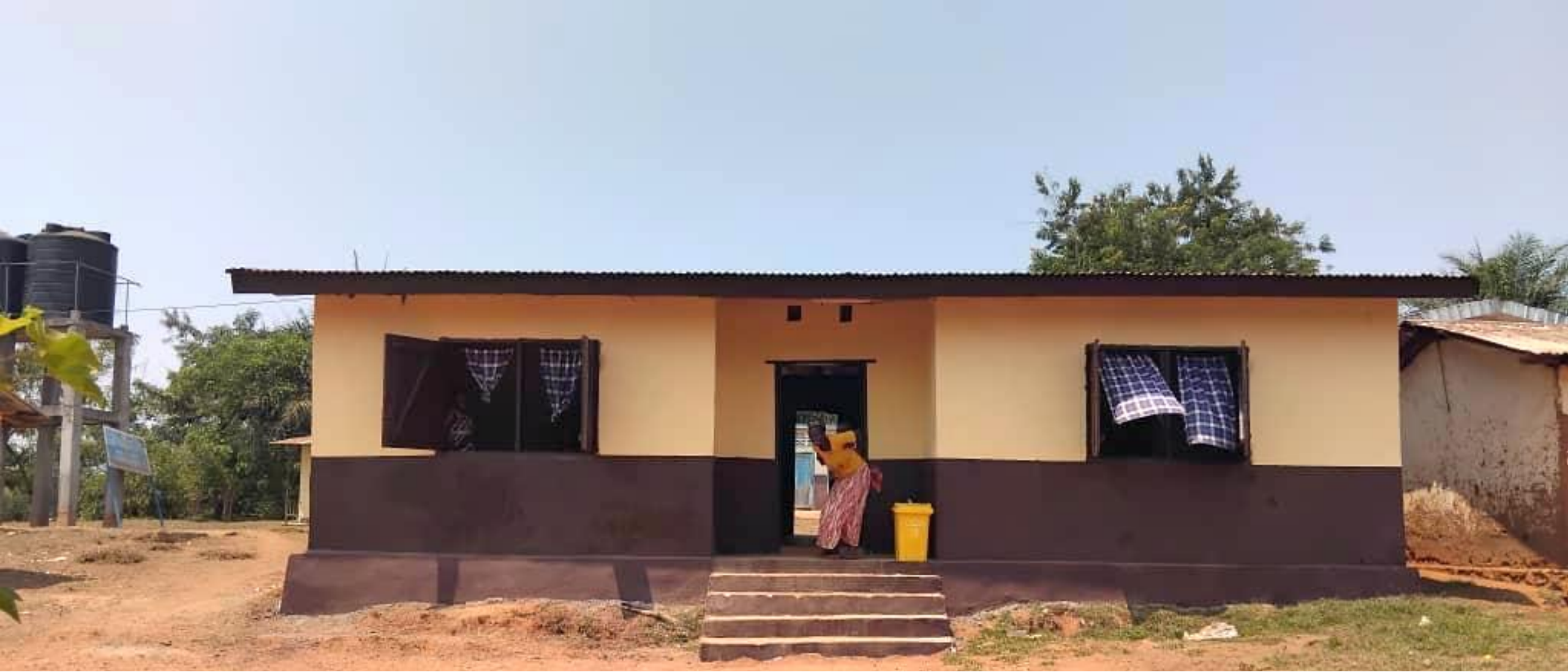
Renovierte Entbindungs- und Wochenbettstation